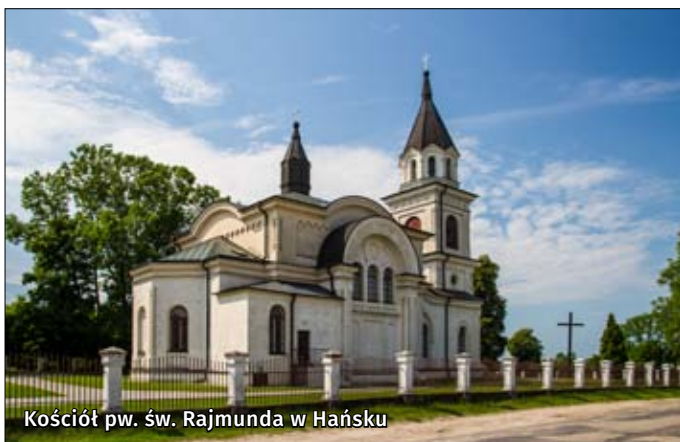
Kościół pw. św. Rajmunda w Hańsku

Muzeum Byłego Obozu Zagłady w Sobiborze (Oddział Państwowego Muzeum na Majdanku) – obóz założono na przelocie kwietnia i maja 1942 r. jako drugi po Bełżcu ośrodek eksterminacji Żydów w ramach „Akcji Reinhardt”. Obóz wybudowano przy stacji kolejowej Sobibór, w obrę-