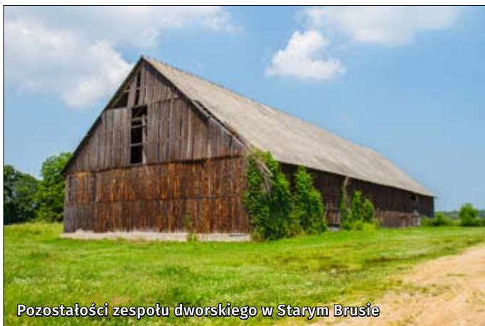
Pozostałości zespołu dworskiego w Starym Brusie

Zespół dworski w Starym Brusie – są to pozostałości dawnego założenia dworskiego. Na szczególną uwagę zasługuje klasyczny spichlerz z połowy XIX w. oraz zabudowania z tego samego okresu, znajdujące się na terenie parku: oficyna, dworska chlewnia, dwa drewniane czworaki.