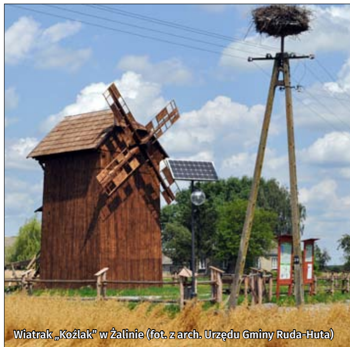
Wiatrak „Kozłak” w Żalinie

Kościół parafialny pw. św. Jana Chrzciciela w Uhrusku – parafia została erygowana w 1551 r. Pierwszy kościół w Uhrusku był drewniany. W latach 1676–1678 w tym miejscu wzniesiono nową świątynię, której pierwotny, późnorennesansowy styl został zatarty podczas przebudowy