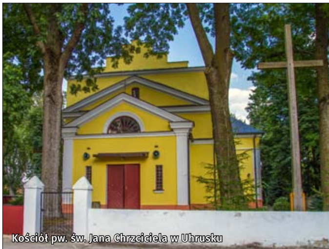
Kościół pw. św. Jana Chrzciciela w Uhrusku

po pożarze w 1807 r. W kościele znajduje się ołtarz z późnobarokowymi rzeźbami z połowy XVIII w. i dwa obrazy: Matki Boskiej Szkaplerznej z XVII w. oraz drugi – Chrystus w Jordanie pochodzący z końca XVII w.